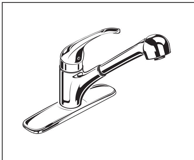
4205 100 Illustré.